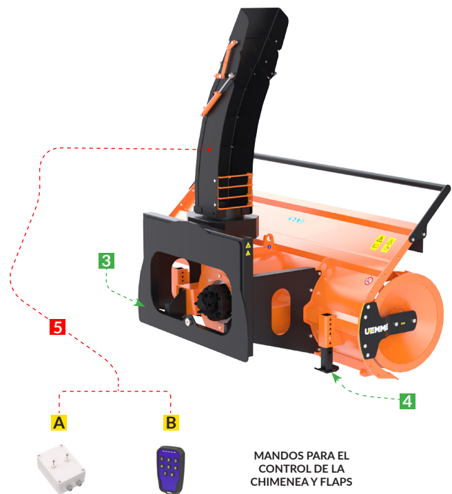
MANDOS PARA EL CONTROL DE LA CHIMENEA Y FLAPS