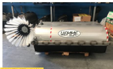
MANTA STD - INOX