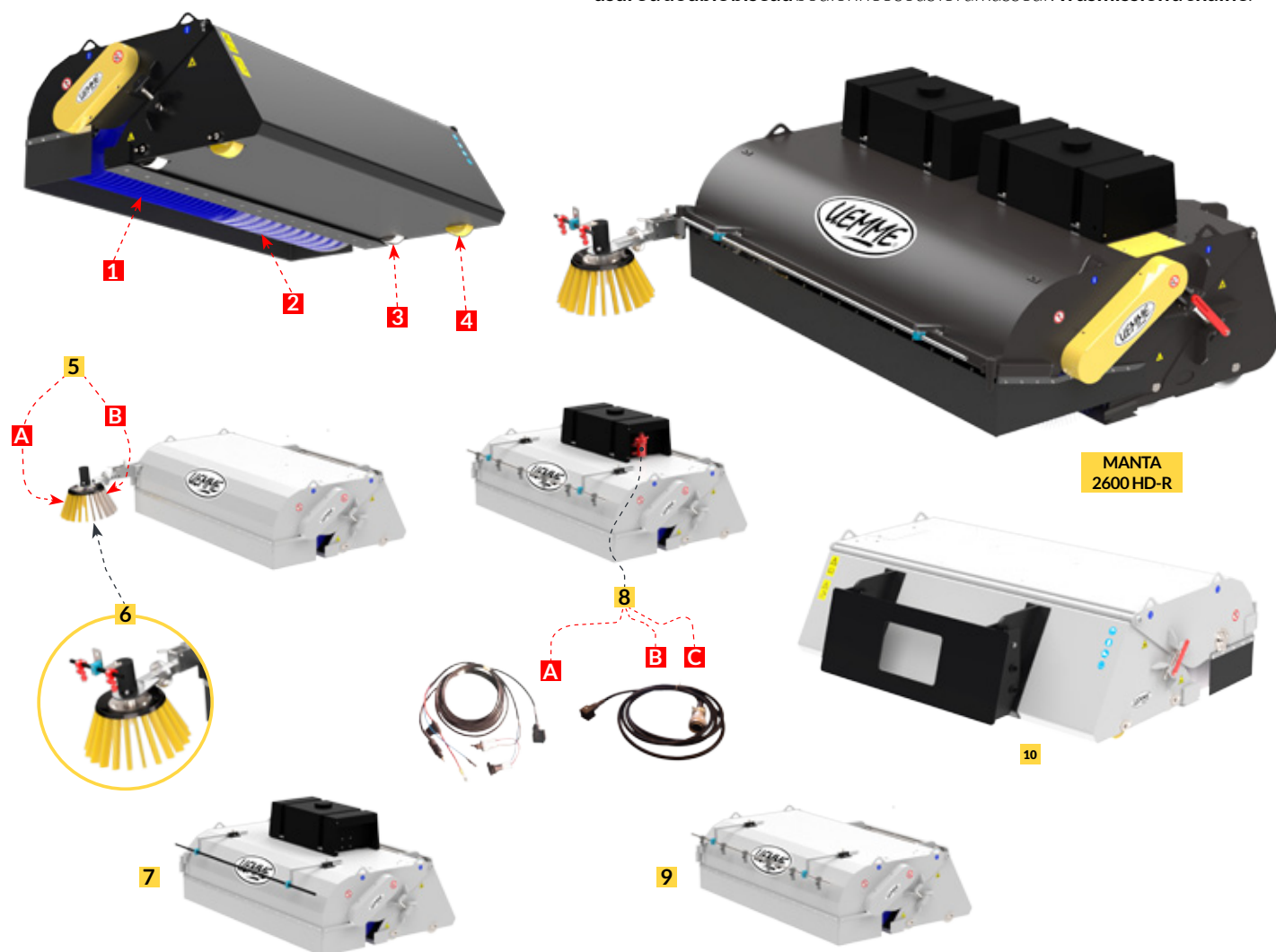
MANTA 2600 HD-R

Balayeuse avec ramasseur pour applications frontales sur grosses machines de terrassement et carrière. Tous les modèles MANTA HD-R sont équipés de série avec 4 roues de roulement (qui peut être choisi en acier ou revêtu de polyzène ), système flottant arrière , protections latérales et antérieures en caoutchouc, flexibles et lame en acier anti-usure à double biseau boulonnées sous le ramasseur. Transmission à chaîne .