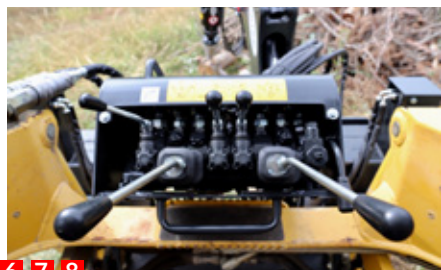
6 7 8